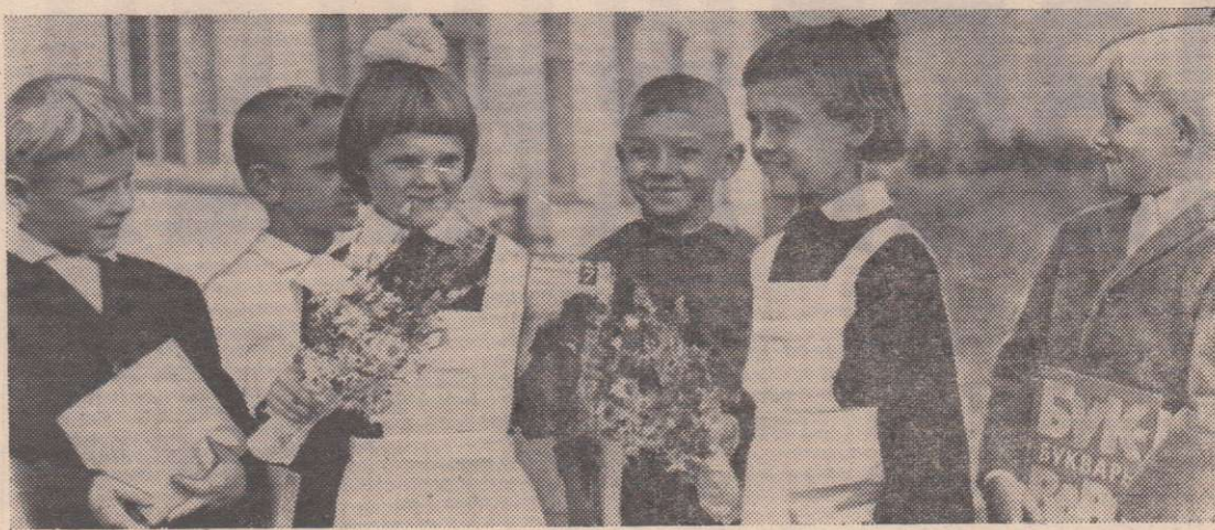
Первый раз в первый класс. с. Денисово.

Член центрального правления Общества советско-вьетнамской дружбы.